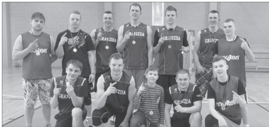
Čempionāta uzvarētāji – "Brieži".