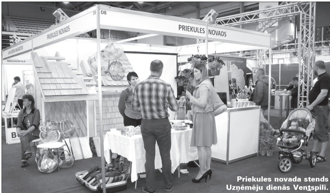
Priekules novada stends Uzņēmēju dienās Ventšpilī.