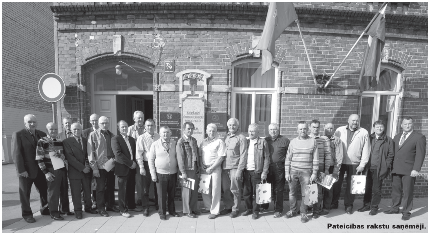
Pateicības rakstu saņēmēji.

Jau vairāk nekā 30 tūkstoši barikāžu dalībnieku visā Latvijā apbalvoti ar 1991. gada barikāžu dalībnieka Piemiņas zīmi, taču, ņemot vērā aizvien lielo cilvēku interesi godināt un izteikt pateicību par paveikto barikāžu laikā, Barikāžu Piemiņas zīmes valde nolēma iedibināt apbalvojumu – pateicības raksts. To piešķir par 1991. gada janvārī un augustā parādīto drošsirdību, pašizliedzību un iniciatīvu, par ieguldījumu organizatoriskajā un apgādes darbā, kā arī par barikāžu dalībnieku morālu un materiālu atbalstīšanu. Pateicības